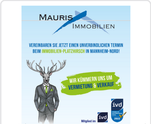
Wir kümmern uns um Vermietung und Verkauf!