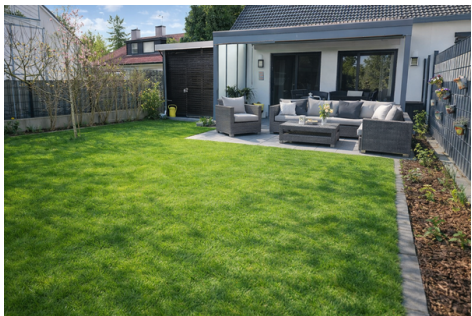
Garten Blick auf Terrasse