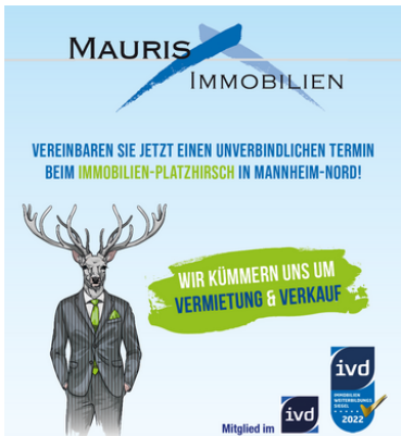
Wir kümmern uns um Vermietung und Verkauf!