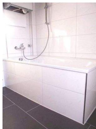
Tageslichtbad Bild 2