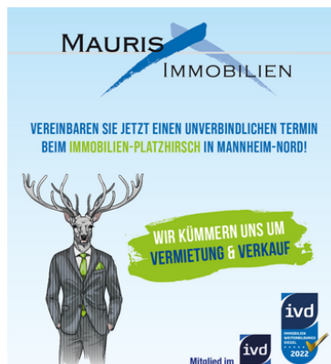
Wir kümmern uns um Vermietung und Verkauf