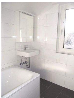
Tageslichtbad Bild 1