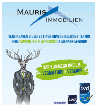
Wir kümmern uns um Vermietung und Verkauf