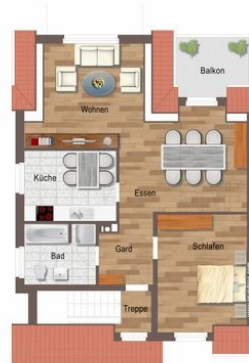
Grundriss untere Ebene