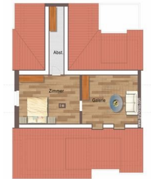
Grundriss obere Ebene