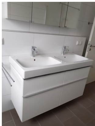
Bad Bild 3.jpg