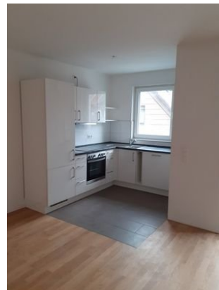
Küche Bild 1.jpg