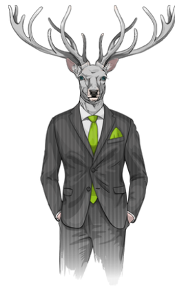
Der Immobilienplatzhirsch in MA-Nord