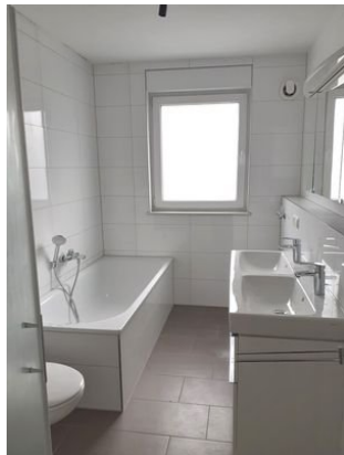
Bad Bild 1.jpg