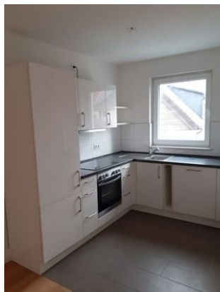
Küche Bild 2.jpg