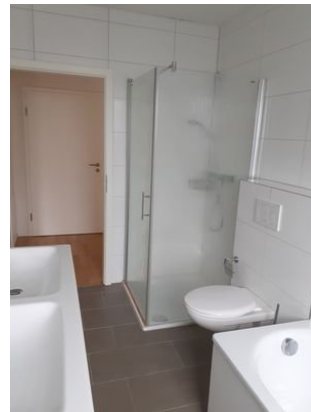
Bad Bild 2.jpg