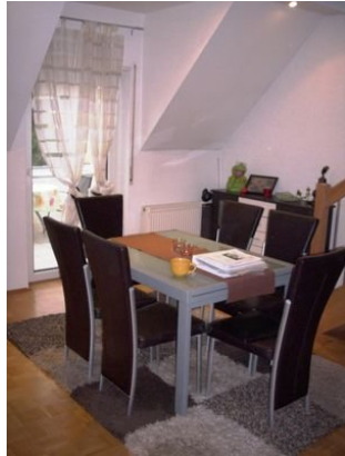
Essen Bild 1.JPG