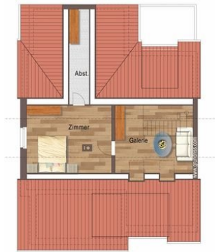
Grundriss obere Ebene.jpg