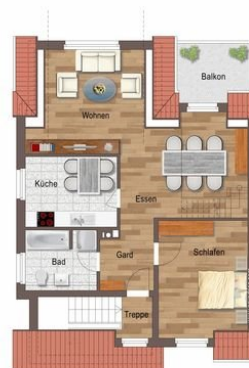
Grundriss untere Ebene.jpg