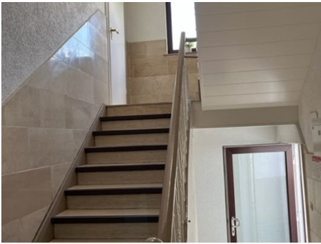
Treppenhaus Bild 1.jpg